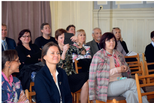
3. ročník konferencie Kultúrne dedičstvo 2019: Divadlo v umení / Umenie v divadle